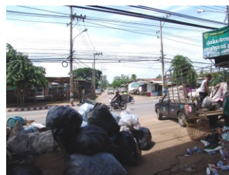
3. ภาพถ่ายฝั่งตรงข้ามของสถานที่ตั้ง