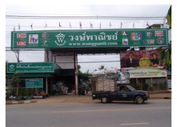
4. ภาพถ่ายของสถานที่ตั้ง