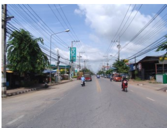
1. ภาพถ่ายสถานที่ใกล้เคียงด้านขวาของสถานที่ตั้ง