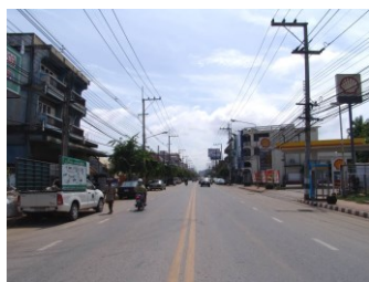
2. ภาพถ่ายสถานที่ใกล้เคียงด้านซ้ายของสถานที่ตั้ง